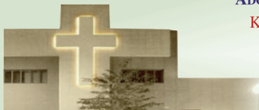
Jezuicki Ośrodek Milenijny

W pierwszy piątek miesiąca - od 17:30 do 19:30